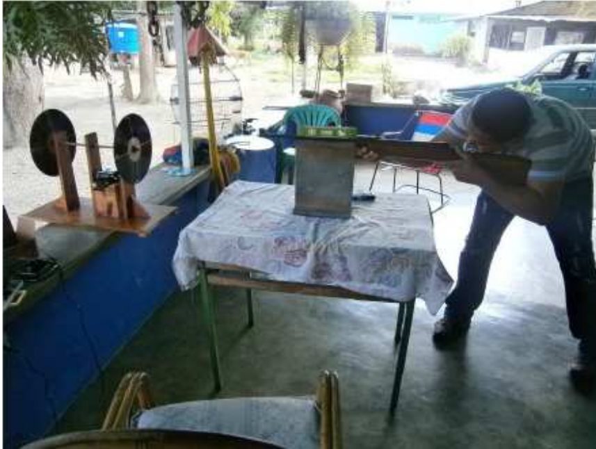
Pruebas de ensayo y error con los discos de acetato