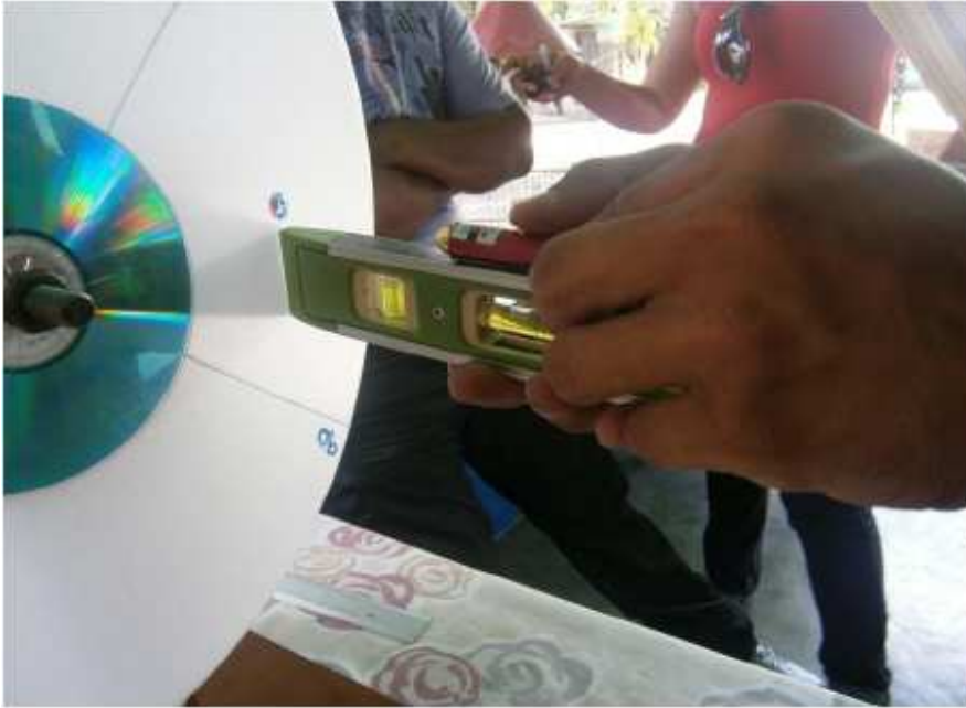
Apreciación de la diferencia de ángulos a través de un láser en las pruebas de ensayo – error