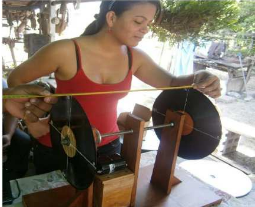
Midiendo la distancia entre los discos