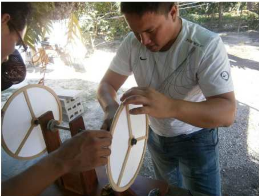
Segundo cambio del montaje con los discos huecos de madera